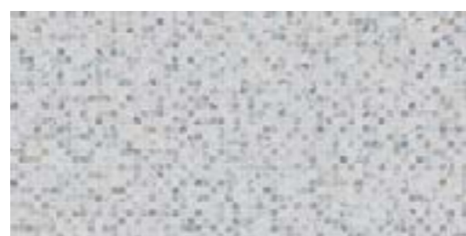
OPCION 1: Nacaré Blanco 33,3 x 66,6