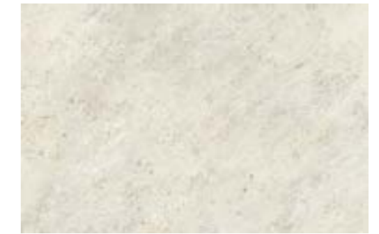
Arizona Caliza 43,5 x 65,9 En suelo