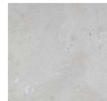
Dover Caliza 44,3 X 44,3 En suelo