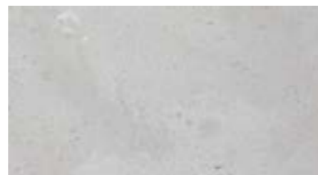
Dover Caliza 31,6 x 59,2 En todo el baño