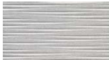
Dover Modern Line 31,6 x 59,2 Pared ducha