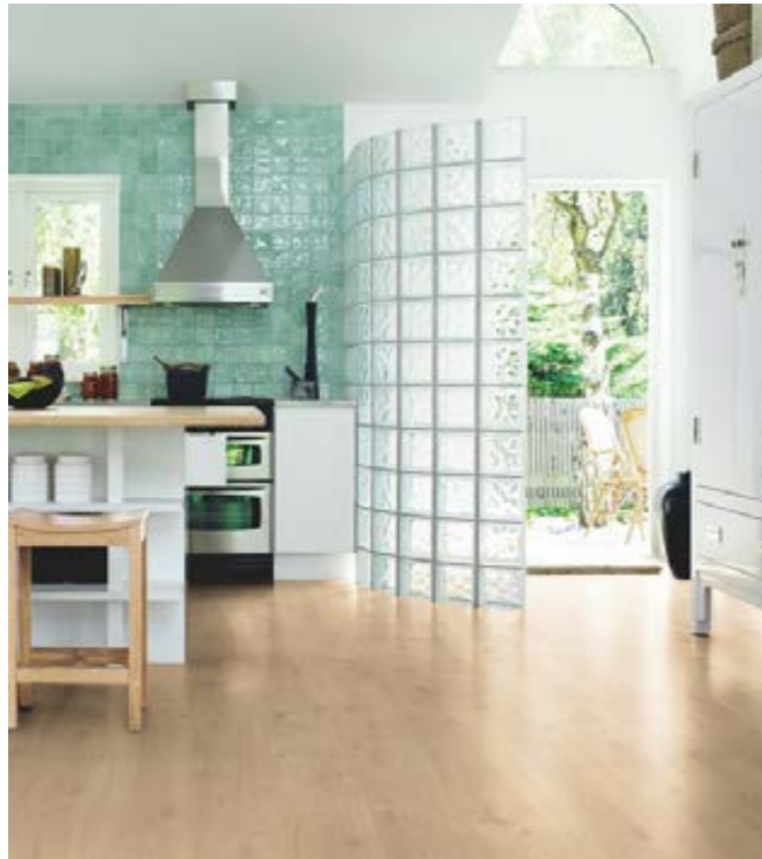
OPCION 1: Pergo Drift Oak Tablón 205 x 20,5