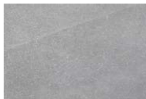
SUELO: Boston Stone 43,5 x 65,9