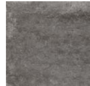
Newport Dark Gray 44,3 X 44,3 En suelo