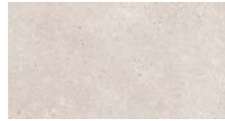
Bottega Caliza 31,6 x 59,2 En todo el baño