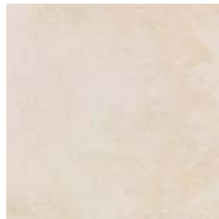
OPCION 2: Newport Beige 59,6 x 59,6 Porcelánico