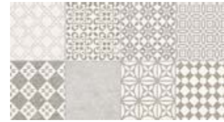
Marbella Stone 31,6 x 59,2 Pared Ducha